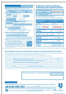
Certificado de registro

Preencha o certificado de registro e entregue através da instituição obstétrica. Guarde este certificado de registro com cuidado por 5 anos após o parto.